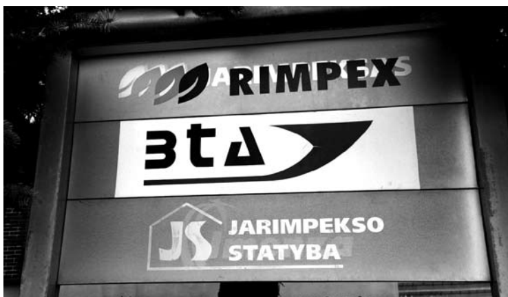
Prie pastato Šaltupio gatvėje vis dar galima įžiūrėti „Jarimpekso“ bendrovės ženklą.

Šiomis dienomis „Anykštai“ pavyko sužinoti, kad pastatas jau turi naujus šeimininkus. Jį nupirko skaitmeninė ir plačiaformate spauda bei fotografijos verslu užsiimanti kaimyniniame Kupiškėje registruota įmonė „Skaitmeninė vizija“.