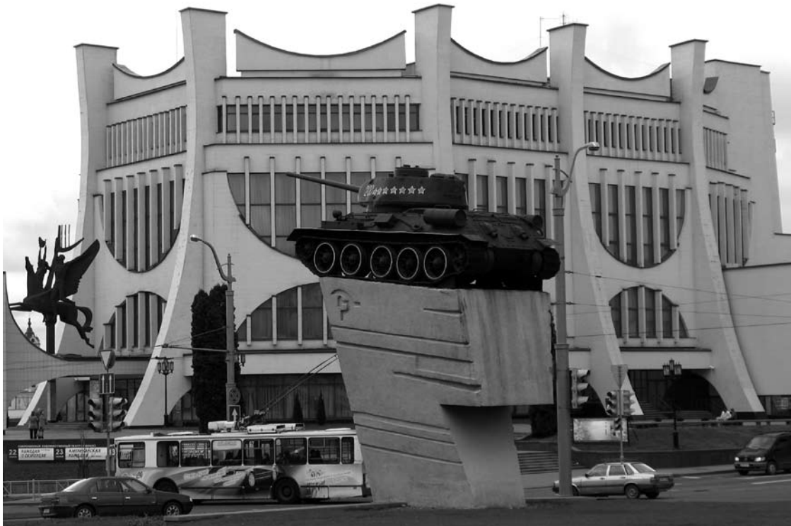
Tankai Padniestrėje – rimta ir sakralu.