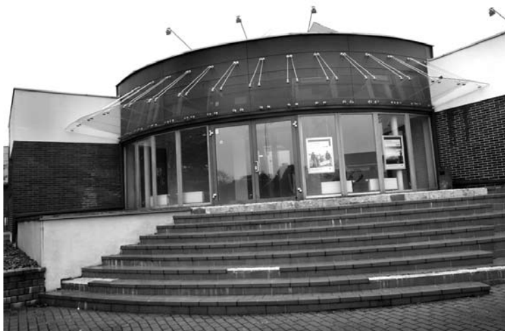
Šiame pastate, prieš tai buvusioje Šaltupio „alinėje, klestėjo „Jarimpekso“, o dabar kursis „Skaitmeninė vizija“.

KAS „Bankrutuoja „Jarimpekso“, „Anykšta“, 2012-04-05) ir neneigė, kad kurs naują įmonę ir iš prekybos pašarais nesitrauks.