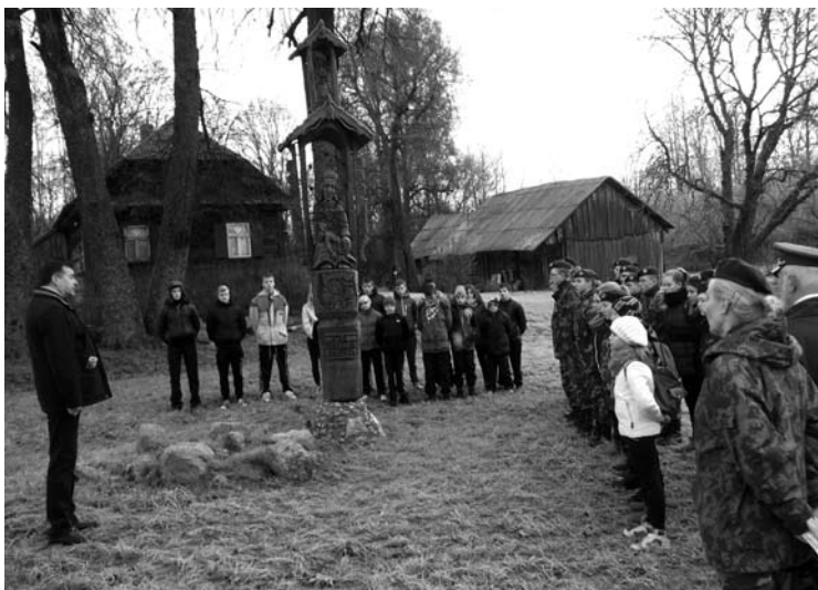
Atmintį reikia žadinti. Tarybinio laiku užsienio „agentais“ laikytų šaulių atminties valandėlė, pagerbiant Troškūnų šaulius.